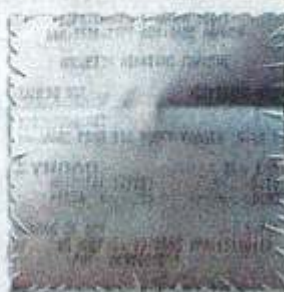
ΣΤΟ ΠΟΣΟ που πληρώνουν οι καταναλωτές συμπεριλαμβάνεται και το βάρος του επίπαγου.

«Βέβαια», συμπληρώνει ο κ. Σιούτης, «υπάρχει μια θεωρία που υποστηρίζουν τα εργοστάσια, σύμφωνα με την οποία ο επίπαγος προστατεύει τα κατεψυγμένα ψάρια από τη στράγγιση και την οξείδωση. Ταυτόχρονα, ο επίπαγος είναι ωφέλιμος και απαραίτητος όταν τα κατεψυγμένα ψάρια διατίθενται στο εμπόριο χύμα. Ωστόσο, με συγκεκριμένη